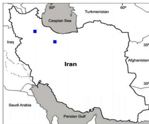
شکل ۶- پراکنش نمونه‌های مطالعه‌شده واریته G. pilosa var. glabra (■).

Fig. 5. Distribution of the studied specimens of two varieties, G. polyclada var. leioclada (■) and G. polyclada var. polyclada (●).