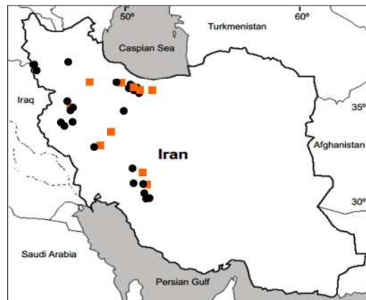
شکل ۵- پراکنش نمونه‌های مطالعه‌شده دو واریته G. polyclada var. leioclada (■) و G. polyclada var. polyclada (●).

Fig. 5. Distribution of the studied specimens of two varieties, G. polyclada var. leioclada (■) and G. polyclada var. polyclada (●).