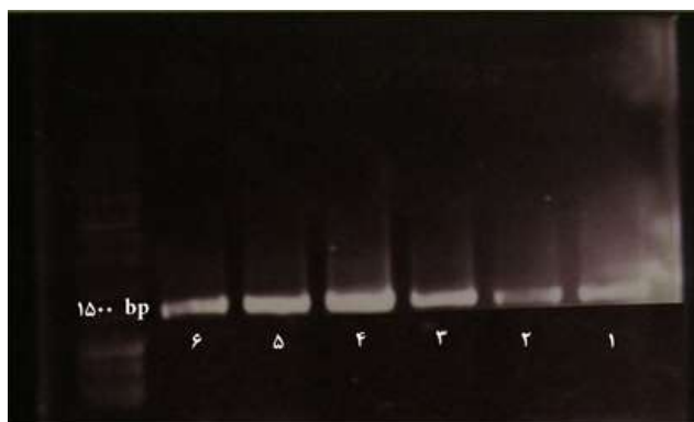
Fig. 1. 2% agarose gel, lane 1 to 6 PCR products of 1413. The temperature increases from right to left.

۱: دما ۵۵°C، محصول PCR مقدار ۱۰ μl، دما ۵۶/۷°C، محصول PCR مقدار ۱۰ μl، دما ۵۸/۲°C، محصول PCR مقدار ۱۰ μl، دما ۶۰°C، محصول PCR مقدار ۱۰ μl، دما ۶۱/۴°C، محصول PCR مقدار ۱۰ μl، دما ۶۲/۵°C، محصول PCR مقدار ۱۰ μl، چاهک آخر ۳ μl نشانگر base ۱۰۰ plus