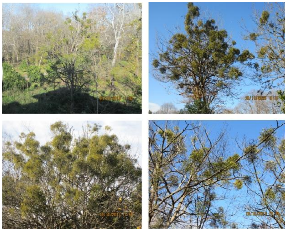
شکل ۱- نمونه‌هایی از درختان آلوده به دارواش با شدت‌های مختلف آلودگی.

به طور کلی، تحقیق حاضر به منظور کسب شواهدی مبنی بر تأثیر مخرب دارواش بر ثبات رشد و فعالیت فتوسنتزی گیاه انجیلی از طریق اندازه‌گیری برخی مشخصه‌هایی که اثبات‌کننده میزان تنش در یک گیاه هستند طراحی شده است.