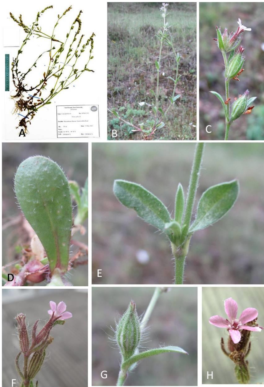
شکل ۲- Silene gallica : A: نمونه هرباریومی SPNH-2292، B: نمای طبیعی گیاه، C: گل آذین، D: برگ قاعده‌ای، E: برگ ساقه‌ای، F: شکل کاسه در زمان گل، G: شکل کاسه در زمان میوه، H: نمای گل.