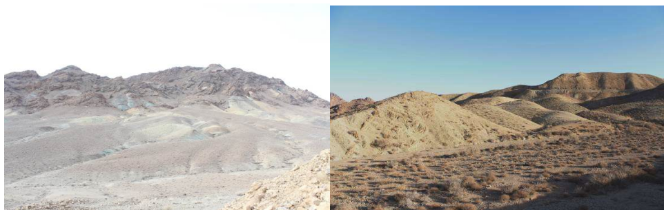
شکل ۱- نماهایی از زیستگاه‌های منطقه شکار ممنوع طالو و شیربند

بر سمی بودن مار گذاشته شد و برای صید آن ابتدا مار را از ناحیه سر مهار و سپس صید انجام شد. پس از مشاهده هر یک از گونه‌ها، یک فرم اطلاعاتی برای آن‌ها تکمیل شد. از جمله اطلاعاتی برای تک تک گونه‌ها ثبت شد، نام گونه (که با استفاده از یک کلید شناسایی معتبر شناسایی انجام شد)، نام محقق، تاریخ مشاهده گونه، ساعت مشاهده، نام جمع‌آوری کننده نمونه، موقعیت جغرافیایی (طول و عرض جغرافیایی)، شرایط جوی، دمای هوا، نوع زیستگاه، نوع پوشش گیاهی، نوع بستر و اطلاعات ریخت‌شناسی و اندازه‌های نمونه ثبت گردید. پس از جمع‌آوری نمونه‌ها و شناسایی و ثبت آن‌ها، تصاویر لازم از هر نمونه با دوربین عکاسی (دوربین ۶۵۰ D Canon و لنز نرمال ۱۸۵۵) تهیه گردید. تعدادی از