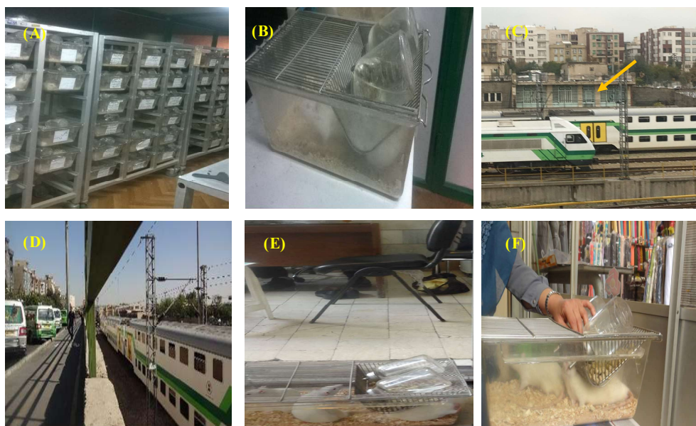
شکل ۱- A-B. محل نگهداری گروه کنترل. C. محل ساختمان اداری رز غربی (اطراف ایستگاه مترو صادقیه. D. خیابان رز غربی. E. گروه تجربی در ساختمان اداری رز غربی. F. گروه تجربی در بازار بزرگ تهران.

Fig. 1. A-B. Control groups. C. West Rose office building location (in the vicinity of Sadeghiyeh metro-station). D. West Rose Street. E. Experimental groups located in West Rose building. F. Experimental groups located in the Tehran Grand Bazaar.