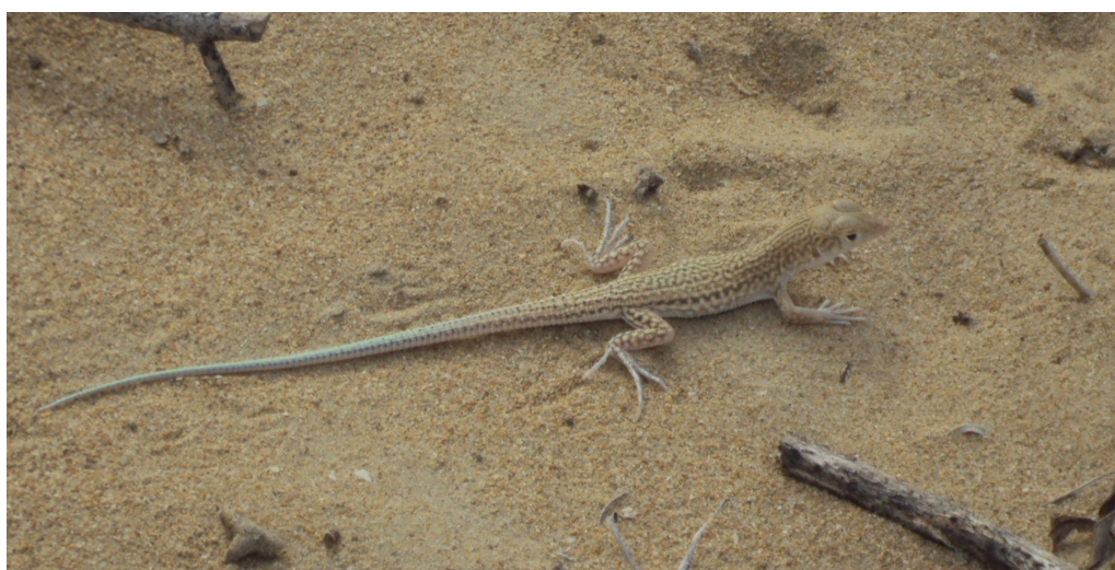
شکل ۱- نمایی از گونه مورد مطالعه A. blanfordi در زیستگاه طبیعی.

در این مطالعه ۴۴ نمونه از مارمولک‌های گونه A. blanfordi (شکل ۱)، در ایران متشکل از ۲۰ نمونه نر و ۲۴ نمونه ماده در جنوب ایران، استان هرمزگان مورد بررسی قرار گرفت. نمونه‌های