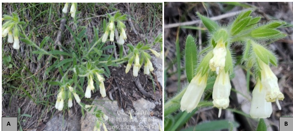
شکل ۲- ظاهر کلی از O. nuristanica A-B. زیستگاه و نمای نزدیک از گل آذین در طبیعت (عکس گرفته شده توسط ع. سلطانی احمدزی در محل). Figure 2. The general appearance of O. nuristanica . A-B. The habit and close-up view of the inflorescence in nature (Photographed by A. Sultani Ahmadzai in the type locality).