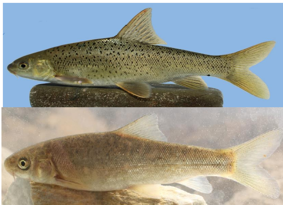
شکل ۱- نمایی جانبی از دو گونه سیاه‌ماهی، بالا: Paracapoeta trutta و پایین: Capoeta damascina رودخانه سیروان Fig 1. The lateral view of Paracapoeta trutta (upper) and Capoeta damascina (below) from Srirvan River