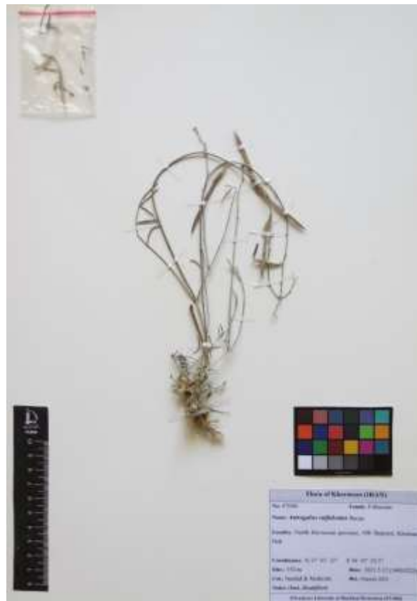
Figure 2. Image of Astragalus suffalcatus Bunge

Leaves are 3–6 cm long, with 2–4 pairs of narrowly ovate to elliptic leaflets, densely pubescent on both surfaces. Inflorescences are racemose, initially dense and 8–10-flowered, later elongating up to 8 cm. Bracts are narrow and triangular. Pods are linear, 30–50 mm long, cylindrical, bilocular, with a short stipe, slightly grooved dorsally, and covered with appressed white hairs; the fruit wall is firm and straw-colored at maturity (Figure 2).