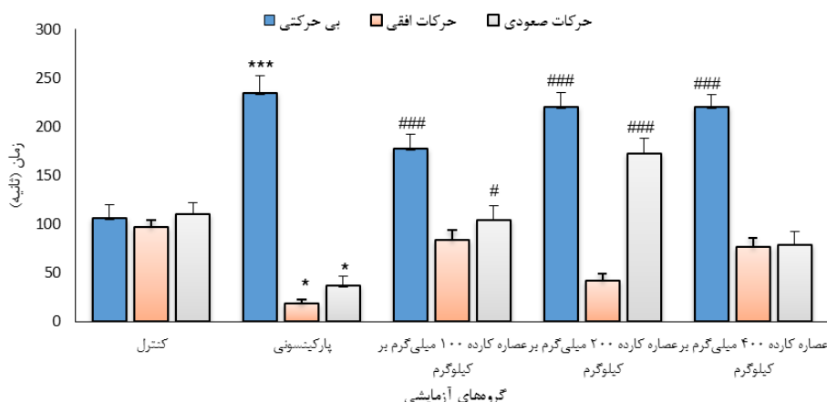
شکل ۱- تأثیر دوزهای مختلف عصاره کارده بر مدت زمان بی‌حرکتی، حرکت افقی و حرکت صعودی در آزمون شنای اجباری. *** نشان دهنده اختلاف معنی‌دار با کنترل در سطح p < 0.001 ، * نشان دهنده اختلاف معنی‌دار با کنترل در سطح p < 0.05 ، ### نشان دهنده اختلاف معنی‌دار با گروه پارکینسونی در سطح p < 0.001 ، # نشان دهنده اختلاف معنی‌دار با گروه پارکینسونی در سطح p < 0.05 .