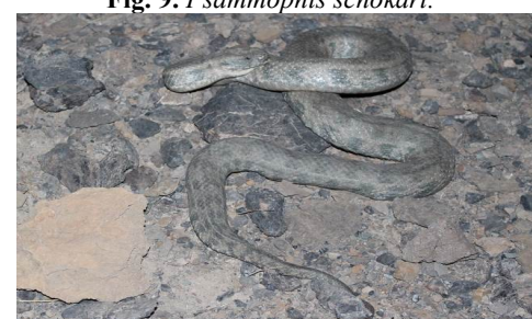
شکل ۱۱- گرزه مار.