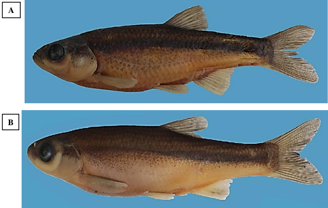
شکل ۱- نمای جانبی دو گونه P. ulanus (A) و A. atropatenae (B) صید شده از رودخانه مهابادچای، حوضه دریاچه ارومیه. Figure 1. Lateral view of Petroleuciscus ulanus (A) and Alburnus atropatenae (B) collected from the Mahabad-Chi River, Urmia Lake basin.