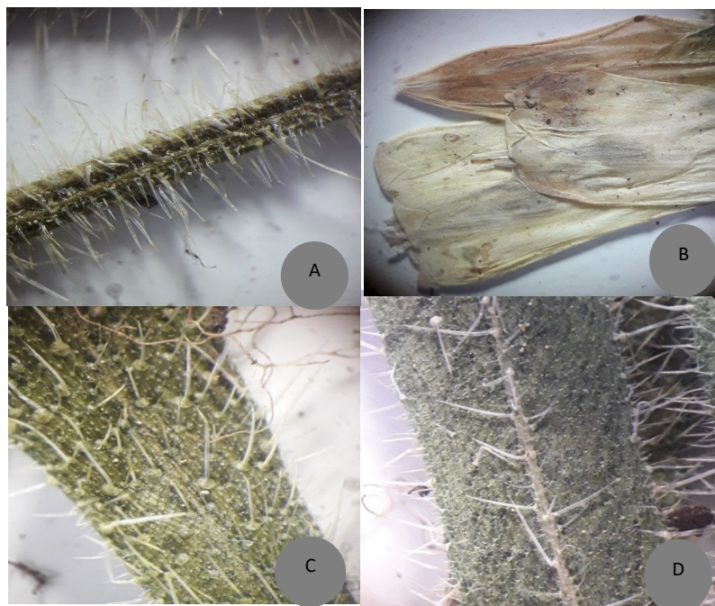
شکل ۴- استریو-میکروگراف پوشش کرک از O. nuristanica : A. ساقه، B. جام گل، C. سطح بالای برگ، D. سطح پایینی برگ.

Figure 4. Stereo-micrographs of indumentum of O. nuristanica : A. stem, B. corolla, C. upper leaf surface, D. lower leaf surface.