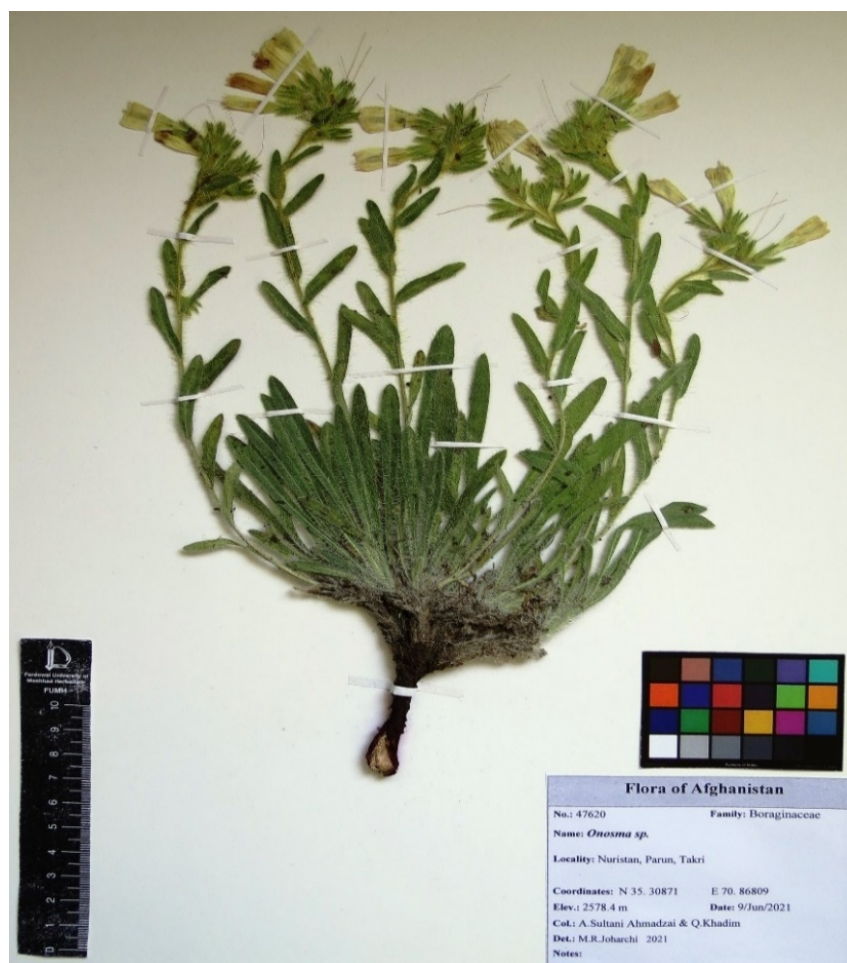
شکل ۳- نمونه O. nuristanica در هرباریوم FUMH (۴۷۶۲۰). Figure 3. The specimen of O. nuristanica in the herbarium of FUMH (47620).