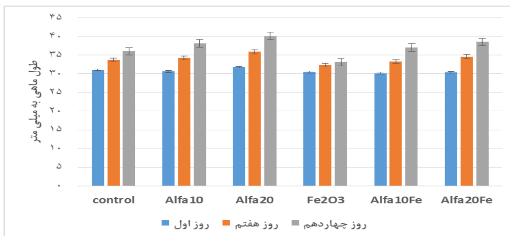
Figure 2. Effects of combined application of iron oxide nanoparticles ( Fe_2O_3 ) and alfalfa treatment on length of fish at the first, seventh and fourteenth days.

مقدار طول ماهی‌ها به طور معنادار مربوط به گروه تیمار با Fe_2O_3 بود. تیمار توأم یونجه با نانوذرات اکسید آهن به ازدیاد معنادار نسبت به گروه نانوذرات آهن منجر شد اما نسبت به گروه های Alfa10 و Alfa20 کاهش معنادار و نسبت به گروه شاهد نیز کاهش غیرمعنادار داشت. بیشترین افزایش در میانگین سرعت رشد اختصاصی، افزایش وزن و افزایش طول مربوط به گروه تیمار با Alfa20 و کمترین مقدار هم مربوط به گروه تیمار با Fe_2O_3 بود. تیمار توأم یونجه با نانوذرات اکسید آهن به ازدیاد معنادار نسبت به گروه نانوذرات آهن منجر شد اما نسبت به گروه های Alfa10 و Alfa20 کاهش داشت.