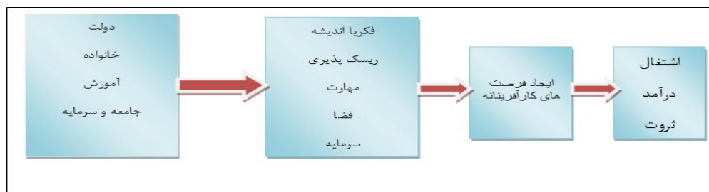
شکل شماره (۱): روند کارآفرینی یا اکوسیستم کارآفرینی

واژه کارآفرینی از کلمه فرانسوی Entrepreneur به معنای متعهد شدن نشأت گرفته است. بنابر تعریف واژنامه دانشگاهی وبستر، کارآفرین کسی است که متعهد می‌شود مخاطره‌های یک فعالیت اقتصادی را سازماندهی، اداره و تقبل کند (احمدپورداریانی، ۱۳۸۷: ۴). عمل کارآفرینی اشاره به کشف، ارزیابی و بهره‌برداری از فرصت‌ها (Shane et al., 2000: 219) و شناسایی فرصت‌های قابل دوام و پایدار است (Martin et al., 2010: 482) و می‌توان آن را معادل نوآوری تعریف کرد (Lauwere et al, 2002: 3) که باعث ایجاد هیجان و انگیزه و همچنین رشد و پیشرفت اقتصادی می‌شود (Pablo Couyoumdjian, 2012: 158). کارآفرینی باعث خلق نوآوری و قبول مخاطرات و منافع آن است (Hisrich et al., 2005: 8). در شکل ۱ روند شکل‌یابی کارآفرینی و ثمرات آن نشان داده شده است.