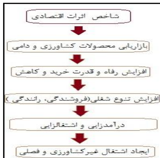
شکل شماره (۱): مدل مفهومی اثرات اقتصادی شهرک صنعتی آق قلا

صنعتی‌سازی نواحی روستایی باشد (دریان‌آستانه، ۱۳۸۳: ۷۷). نواحی صنعتی موجب افزایش درآمد روستاییان و کاهش اختلاف درآمد بین شهرنشینان و روستاییان گردیده (Sunder, 2009: 28-29) و میان آن‌ها پیوند ایجاد می‌کند؛ همچنین صنایع روستایی به تحکیم الگوی عدم تمرکز صنایع می‌انجامد (Walker, 2007: 3). با توجه به رشد بالای جمعیت و محدودیت زمین کشاورزی، صنایع روستایی می‌تواند با ایجاد فرصت‌های شغلی جدید نسبت قابل قبولی از نیروی کار را جذب نموده و آهنگ رشد نرخ بیکاری را کاهش دهد و زمینه را برای توسعه روستاها هموارتر سازد (Maran, 2007: 86). صنعت علاوه بر افزایش نرخ اشتغال، به‌عنوان یکی از بخش‌های غیرکشاورزی، منجر به افزایش درآمدهای غیرمحل‌ی گردیده و به صورت مستقیم و غیرمستقیم در مدرنیزاسیون بخش کشاورزی نیز نقش عمده‌ای دارد (Das, 2009: 1). صنعتی‌سازی روستاها منجر به تحول در اقتصاد روستایی گردیده و با جذب قسمتی از جمعیت روستا، تا حدی مشکل بیکاری را مرتفع نموده است (Sunder, 2009: 29)؛ همچنین با برقراری پیوند با کشاورزی، موجبات رشد آن را فراهم می‌آورد (Hwa, 1989: 45). به همین دلیل صنعتی شدن جایگاه مهمی در راهبردها و سیاست‌های کشورهای در حال توسعه دارد (Dutta, 2004: 334). استقرار صنایع در روستا قادر است فرصت‌های شغلی و درآمدی بیشتر ایجاد کند و از این رو بستر مناسبی برای توسعه روستایی به‌شمار می‌آید (حاجی‌نژاد، ۱۳۸۵: ۲۰).