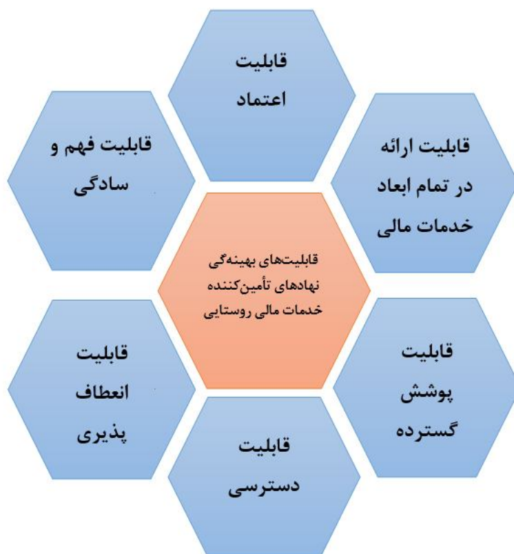
شکل شماره (2): الگوی تحلیلی بهینه‌گی نهادهای تأمین خدمات مالی نواحی روستایی

مجریان دستگاه‌های مالی که تمام اعتبارات اعطائی به روستاییان باید در محدوده زراعت و دامداری خلاصه گردد، موجبات حذف شدن بخشی از مشتریان را فراهم می‌آورد و این پنداشت با توجه به سبک معیشتی زارعان و دامداران خرده‌پا باید جای خود را به "اعتقاد به درهم‌تنیدگی ابعاد مختلف زندگی" این قشر از جوامع روستایی دهد؛ چراکه مخارج گوناگون آنان بهم وابسته بوده و چه بسا در بسیاری از موارد هزینه کردن آن مبلغ در کار غیرکشاورزی به طور غیرمستقیم بر رونق کشاورزی مورد فایده واقع گردد. وان‌پیش (1991)، روبینسون (2001)، ام. ال. داوان، 1393؛ جوانمردی (1384)، در پژوهش‌شان ضمن تأکید بر این نکته، معتقدند که نباید چنین تصور کرد که هزینه کرد اعتبار دریافت شده در بخش غیرزراعی و دامداری موجب تلف شدن منابع مالی است؛ بلکه به طور غیرمستقیم هزینه‌کردها بر هم اثرگذار است. در مجموع، با توجه به بحث‌های انجام شده در زمینه‌ی قابلیت‌های نهادهای تأمین‌کننده خدمات مالی نواحی روستایی می‌توان الگوی بهینه‌گی این نهادها را در قالب شکل 2 نشان داد: