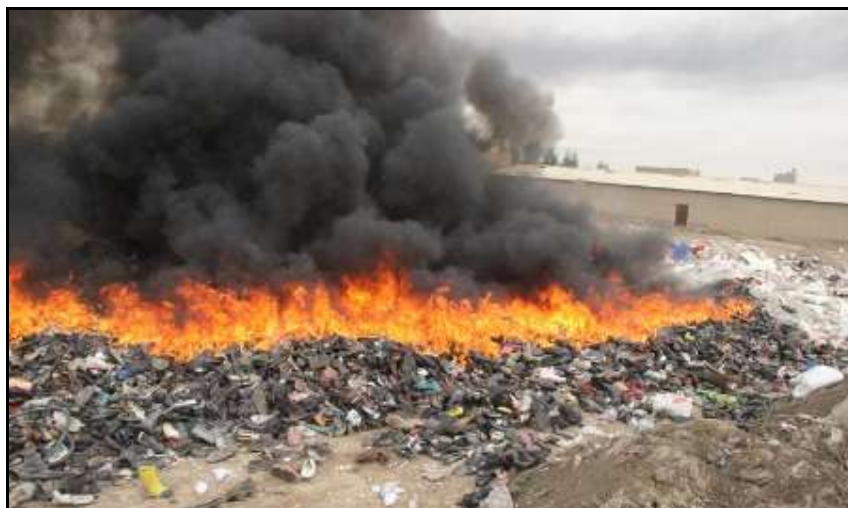
شکل شماره (۳): نمونه‌ای از آتش زدن زباله‌های شهری در محل دپوی زباله در اطراف تهران