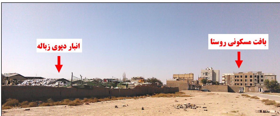
شکل شماره (۲): انبار دپوی زباله‌های شهر تهران در مجاور روستای اسلام‌آباد

هـ مختل ساختن عملکرد مدیریت روستایی در کانون‌های مجاور؛ بنا به مشاهدات میدانی و مصاحبه‌ی صورت گرفته، به دلیل اینکه بسیاری از انبارهای نگهداری زباله در نزدیکی روستاها بوده (شکل ۲)، بسیاری از آشغال‌ها را باد به داخل محدوده‌ی روستا حمل می‌کند که امر نظافت محیط روستایی را با چالش جدی هر روزه مواجه ساخته است. همچنین، بسیاری از آتش‌زدن‌های زباله‌ها در خارج از محوطه-های نگهداری زباله صورت می‌گیرد (شکل ۳) که نیروهای دهیاری به منظور جلوگیری از انتشار آتش در مزارع و یا منازل روستا مجبور به راه‌اندازی "گشت‌های آتش خاموش کن" شده‌اند که به نوعی حاکی از هدر رفت انرژی و توان این بخش مدیریت روستایی است.