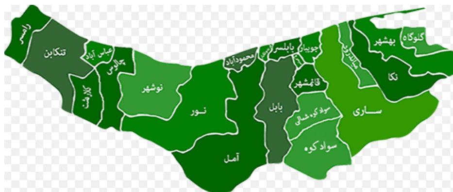
شکل شماره (۲) موقعیت شهرستان قائم شهر در استان مازندران

شهرستان قائم‌شهر در ۲۶ درجه و ۲۱ دقیقه تا ۳۶ درجه و ۳۸ دقیقه شمالی و ۵۲ درجه و ۴۳ دقیقه تا ۵۳ درجه و ۳ دقیقه طول شرقی از نصف النهار گرینویچ قرار گرفته است. این شهرستان ۴۵۸۵ کیلومتر مربع وسعت دارد. شهرستان قائم‌شهر از شمال به شهرستان جویبار، از جنوب به شهرستان سوادکوه، از شرق به شهرستان ساری و از غرب به شهرستان بابل محدود می‌شود. شهرستان قائم‌شهر دارای ۲ شهر، ۲ بخش، ۶ دهستان، ۱۵۶ آبادی دارای سکنه و ۳ آبادی خالی از سکنه است (استاندارداری استان مازندران، ۱۳۹۴). نقشه شماره ۱ موقعیت شهرستان قائم شهر را در استان مازندران نشان می‌دهد.