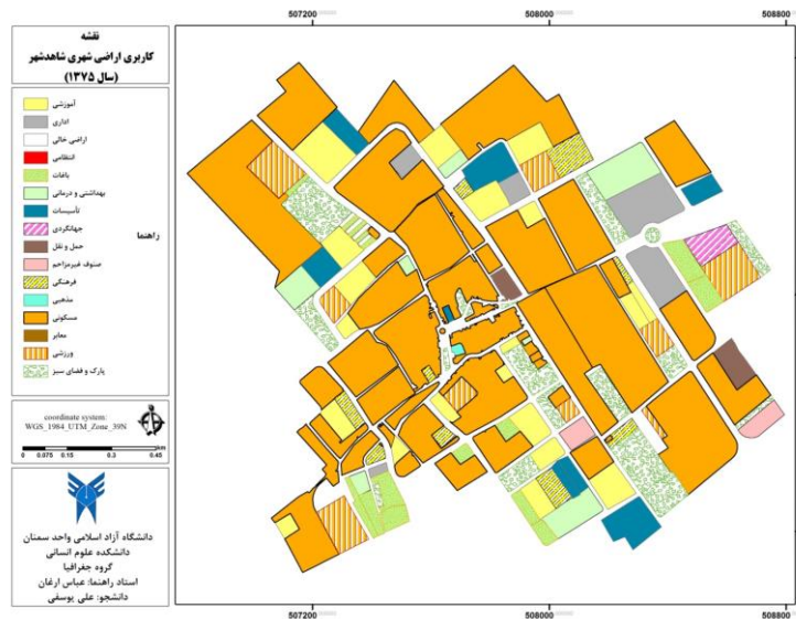
شکل شماره (۱) نقشه کاربری اراضی شاهد شهر در سال ۱۳۷۵