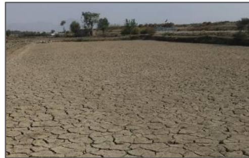
شکل ۲. عدم کشت و رهاسازی شالیزار در ناحیه لنجان علیا