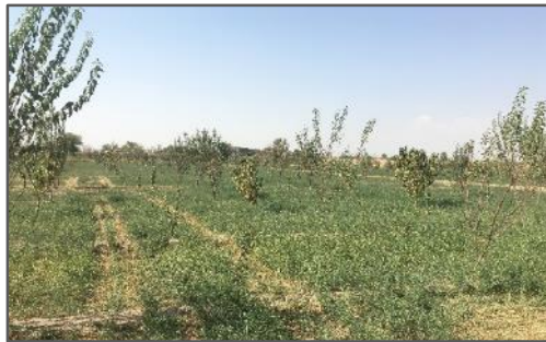
شکل ۳. تغییر کاربری شالیزار به باغ میوه در ناحیه لنجان سفلی

وجود آمده در فرایند تولید کشاورزی را به مثابه ناپایداری الگوی کشت ارزیابی می‌نمایند که پیامد آن تغییر و تخریب اراضی، تضعیف نظام اقتصاد کشاورزان و در نهایت افزایش مهاجرفرستی و تخلیه‌ی روستاهاست (شکل ۲ و ۳). درک تغییرات به وجود آمده به مثابه‌ی ناپایداری الگوی کشت در ناحیه روستایی لنجان در قالب یک مدل زمینه‌ای شامل عوامل تأثیرگذار / کنترل‌کننده، تأثیرات اولیه، پیامدهای اولیه و پیامد ثانویه در شکل ۴ ارائه شده است.