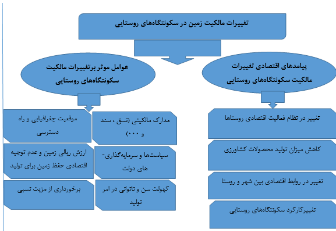
شکل ۱. مدل مفهومی پژوهش