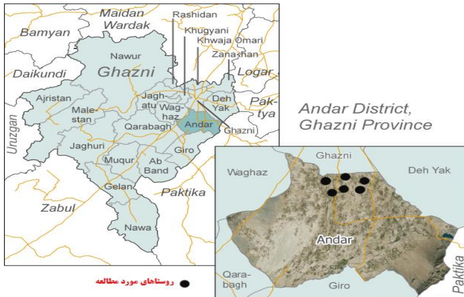
شکل ۱. موقعیت جغرافیایی محدوده مورد مطالعه در کشور افغانستان، استان غزنی، شهرستان اندر