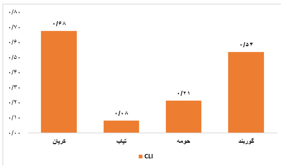
شکل ۳. نمودار رتبه بندی دهستان‌ها بر اساس امتیاز تاپسیس