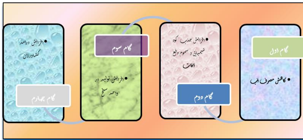
شکل ۳. اثرات کشت هیدروپونیک

الگوریتم خوشه‌ای کردن روستاها به منظور ظرفیت‌سنجی کشت هیدروپونیک با روش تحلیل خوشه-ای