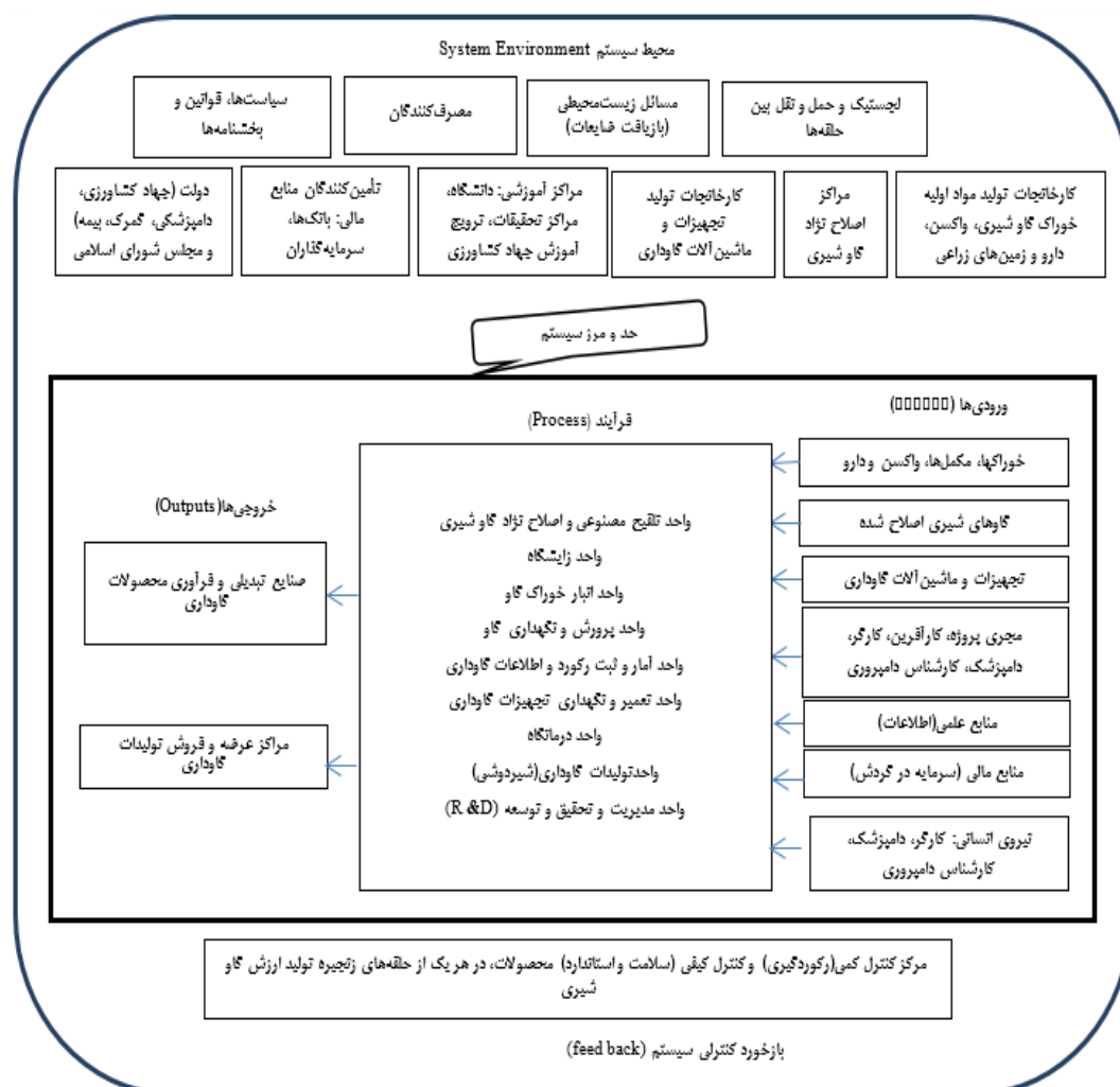
شکل ۱. مدل مفهومی تحقیق