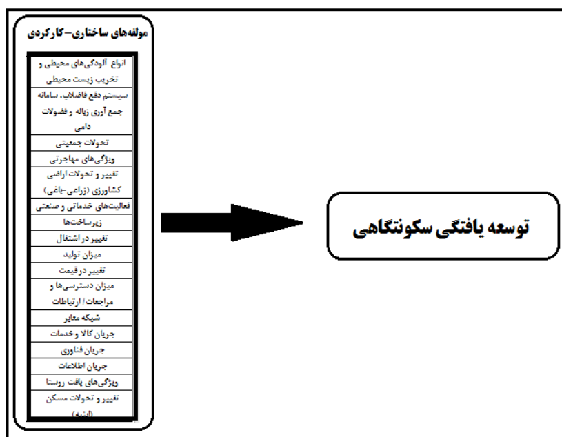
شکل ۱. مدل مفهومی تحقیق