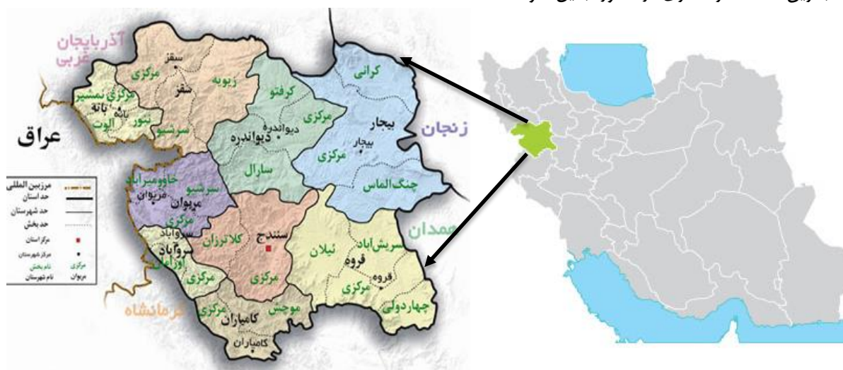
شکل ۲. موقعیت جغرافیایی محدوده مطالعاتی

استان کردستان یکی از استان‌های ایران به مرکزیت شهر سنندج است که در غرب کشور واقع شده است. مساحت این استان ۲۸۲۰۰ کیلومتر مربع معادل ۱/۷ درصد مساحت کل کشور ایران است. این استان که در دامنه‌ها و دشتهای پراکنده سلسله جبال زاگرس میانی قرار گرفته است، از شمال به استان‌های آذربایجان غربی و زنجان، از شرق به همدان و زنجان، از جنوب به استان کرمانشاه و از غرب به اقلیم کردستان و کشور عراق محدود است. استان کردستان با کشور عراق ۲۰۰ کیلومتر مرز مشترک دارد. استان کردستان براساس آخرین تقسیمات کشوری در سال ۱۳۹۰ دارای ۱۰ شهرستان، ۲۹ شهر، ۳۱ بخش، ۸۶ دهستان و ۱۶۹۷ آبادی دارای سکنه و ۱۸۷ آبادی خالی از سکنه بوده است. شهرستان‌های این استان عبارتند از: مریوان، بیجار، دهگلان، دیواندره، سروآباد، سقز، سنندج، قروه، کامیاران و بانه. بر پایه سرشماری عمومی نفوس و مسکن سال ۱۳۹۵ استان کردستان ۱۶۰۳۰۱۱ نفر جمعیت دارد که ۶۶ درصد شهری و ۳۴ درصد را جمعیت روستایی تشکیل می‌دهد. تراکم نسبی جمعیت معادل ۲/۵۱ نفر در کیلومتر مربع است. موقعیت جغرافیایی استان کردستان، آب‌وهوای مطبوع و طبیعی، وجود تفرجگاه‌های جنگلی، آبشارهای فصلی، صنایع دستی و سوغات محلی، مجاورت در مرز اقلیم کردستان عراق و وجود کالاهای خارجی ارزان قیمت، این استان را به یکی از جذاب‌ترین مقاصد گردشگری در کشور تبدیل نموده است.