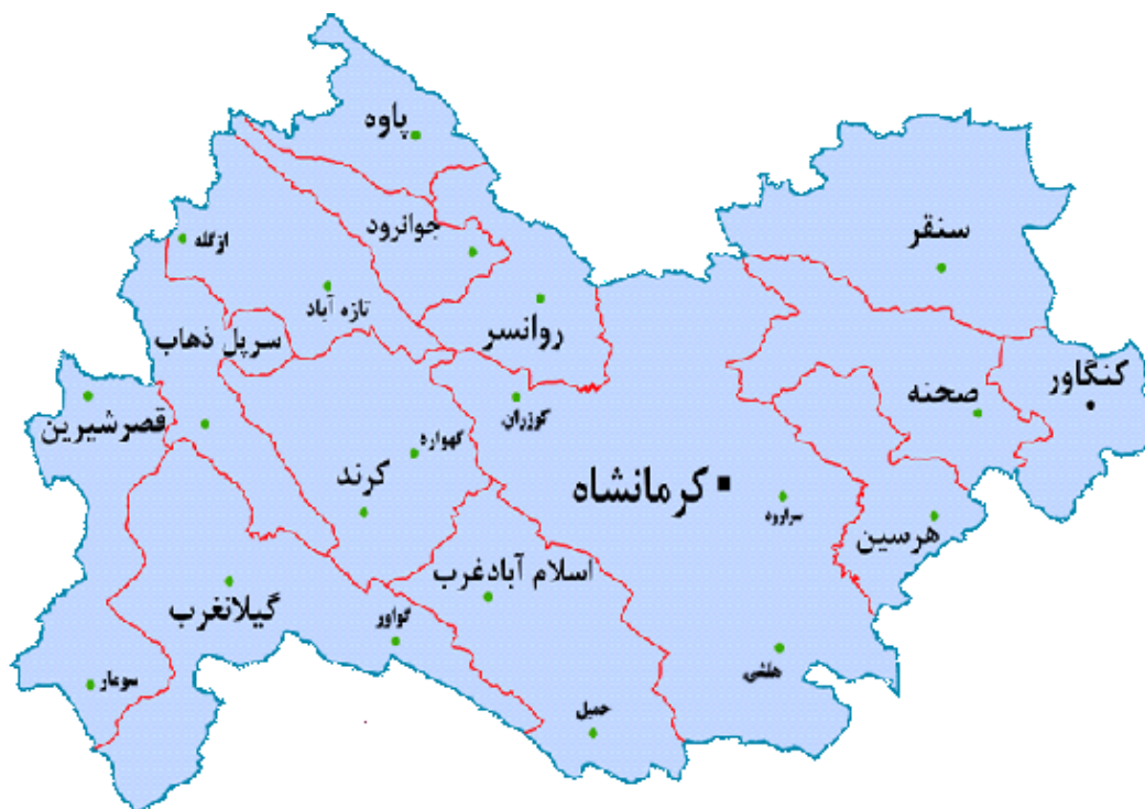
شکل ۱. نقشه استان کرمانشاه و محدوده‌های مکانی پژوهش