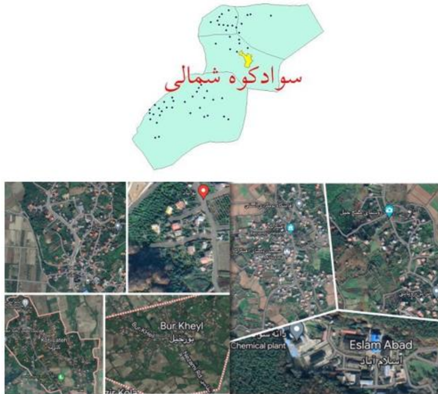
شکل ۲. محدوده مورد مطالعه در تقسیمات استان مازندران