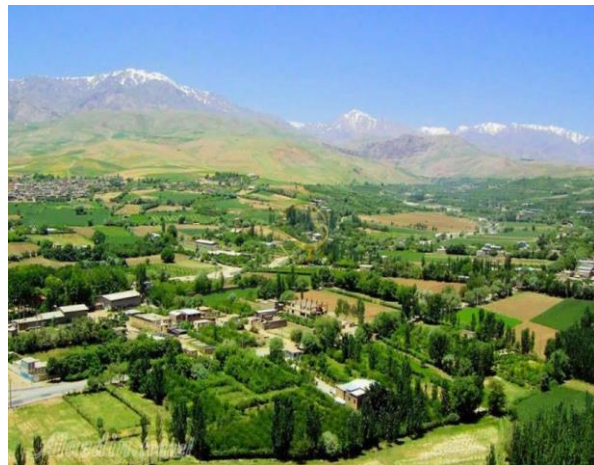
شکل ۵. تغییر چشم‌انداز روستا شهر گلدشت بر اثر ساخت خانه‌های دوم، مأخذ (نگارندگان: ۱۴۰۲)