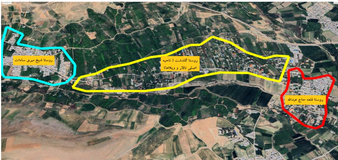
شکل ۴. منطقه روستا شهری گلدشت در سال ۱۴۰۲، مأخذ (گوگل ارث، ۱۴۰۲)