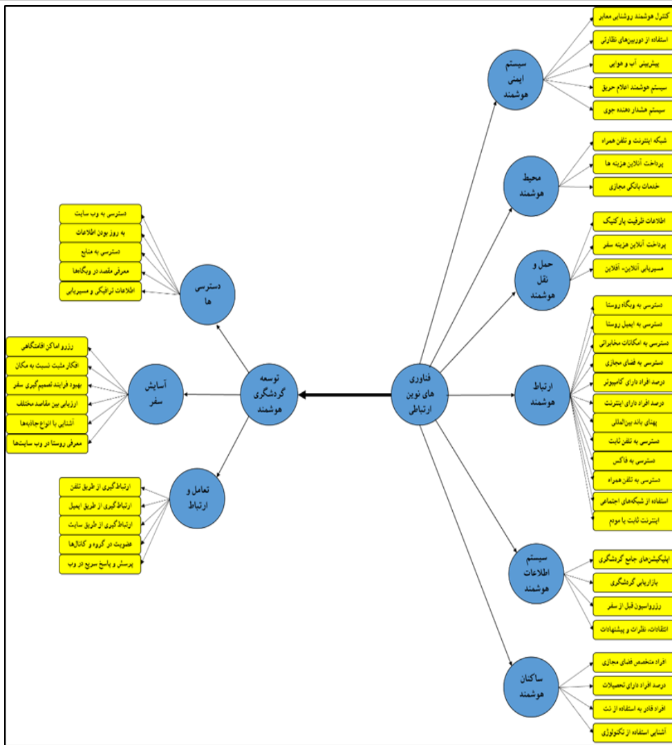
شکل ۱. مدل مفهومی پژوهش