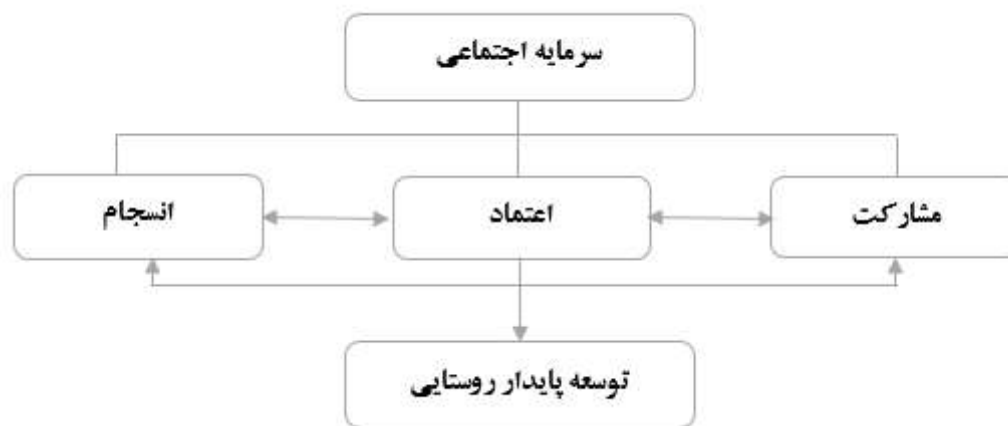
شکل ۱. مدل نظری پژوهش

اعتماد، هسته مرکزی بسیاری از مفاهیم کاربردی موجود در تئوری‌های علوم اجتماعی است که برای تبیین فرایندهای زندگی روزمره از جمله رضایت از زندگی، رونق اقتصادی، آموزش، رفاه، مشارکت، جامعه مدنی، دموکراسی، مردم سالاری و غیره به کار گرفته می‌شود (Delhey, Newton, & Welzel, 2011). در بررسی ادبیات جامعه‌شناختی مفهوم اعتماد به سه رهیافت فکری وجود دارد: اعتماد به منزله ویژگی فردی افراد، اعتماد به منزله عاملی در ارتباطات اجتماعی و نهایتاً هم اعتماد به عنوان ویژگی نظام اجتماعی با تأکید بر رفتار مبنی بر تعاملات و سوگیری‌ها در سطح فردی، مفهوم‌سازی شده است (Misztal, 2001). با عنایت به مفهوم سرمایه اجتماعی و ابعاد سه گانه آن مدل مفهومی تحقیق به شکل زیر ارائه می‌گردد.