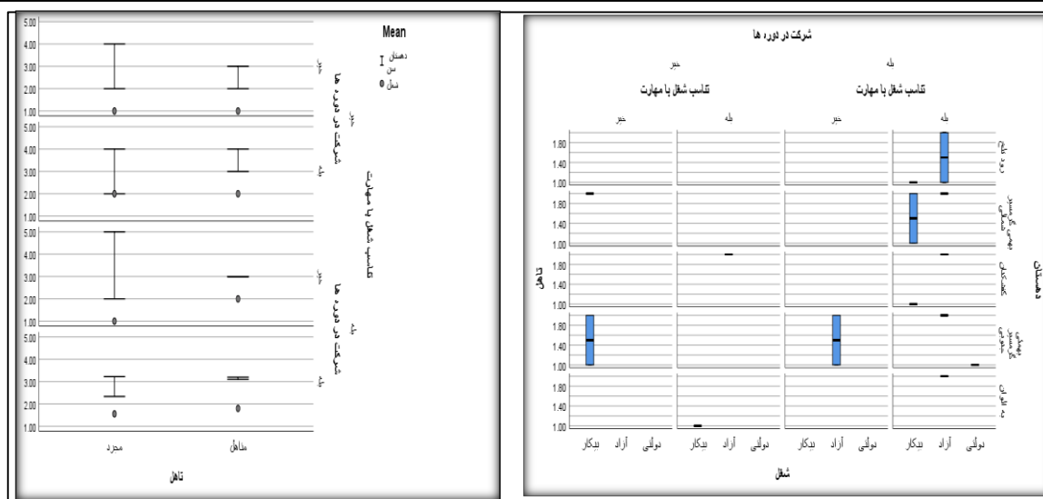
شکل ۳. وضعیت دو شاخص شرکت در دوره و تناسب دوره با شغل

اکنون نیاز است که چهار عامل مورد بررسی و زیرشاخه‌های آن‌ها در روستاهای مورد مطالعه کنکاش شوند. برای این منظور از مدل رتبه‌بندی مارکوس استفاده شده است که نتایج نهایی این مدل در جدول (۲) و شکل (۴) مشخص هستند.