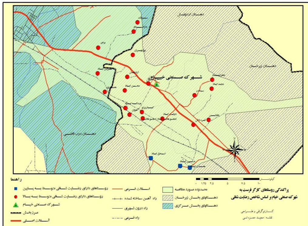
شکل شماره (۲): نقشه وضعیت رضایت شغلی در روستاهای منتخب

با توجه به غیرنرمال بودن توزیع مقادیر این متغیر برای ارزیابی آن از آزمون «من ویتنی» استفاده شد. همانطور که در جدول شماره ۲ ملاحظه می‌شود، مقدار احتمال آزمون برابر با ۰/۰۰۵ و از ۰/۰۵ کوچکتر است. با توجه به اینکه میانگین رضایت شغلی کارگران شهرک کمتر از سایر شاغلین است، این بخش از فرضیه اول تحقیق رد می‌شود. به عبارتی، اشتغال در شهرک صنعتی خیام همراه با رضایت شغلی نبوده است. نکته جالب توجه این است که با جدا کردن کارگران سه روستای اسحق‌آباد، حسین‌آباد و عصمت‌آباد (۲۰ درصد شاغلین شهرک) از کارگران شهرک نتیجه برعکس و به نفع گروه هدف به دست آمده است. این امر به این دلیل است که عامل فاصله در رضایت شغلی کارگران مؤثر بوده است؛ زیرا کارگران روستاهای دوردست‌تر مجبورند هر روزه مسافت زیادی را از محل سکونت تا شهرک با موتور سیکلت و یا با پرداخت کرایه طی نمایند. بنابراین به استثنای روستاهای فوق‌الذکر در ۸۰ درصد موارد شهرک صنعتی خیام موفق به ایجاد رضایت شغلی در کارگران روستایی شهرک صنعتی خیام شده است.