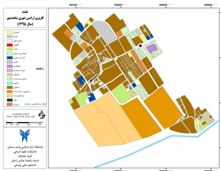
شکل شماره (۲) نقشه کاربری اراضی شاهد شهر در سال ۱۳۹۵