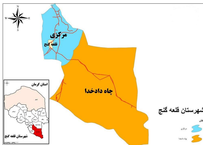
شکل ۱. نقشه موقعیت جغرافیایی محدوده مورد مطالعه

شهرستان قلعه گنج بین ۲۷ درجه عرضی و ۵۷ درجه طول جغرافیایی قرار گرفته است، از شمال به شهرستان کهنوچ، از جنوب به بندر جاسک، از جنوب شرق به استان سیستان و بلوچستان ( شهرستان های ایرانشهر و نیک شهر )، از شرق به شهرستان رودبار از غرب به منوجان محدود می‌شود. مساحت شهرستان ۱۴۲۰۰ کیلومتر مربع معادل ۳/۳ درصد از کل مساحت استان است و فاصله تا مرکز استان ۴۲۰ کیلومتر است. شهرستان قلعه گنج دارای ۲ بخش مرکزی و چاه دادخدا و ۵ دهستان به نامان دهستان رمشک، مارز، چاه دادخدا، قلعه گنج و سرخ قلعه است.