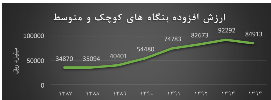
شکل ۱. نمودار ارزش افزوده بنگاه‌های کوچک و متوسط

ارزش افزوده کسب و کارهای کوچک و متوسط همانطور که در شکل (۱) ملاحظه می‌شود دارای روند صعودی از سال ۱۳۸۷ تا سال ۱۳۹۳ می‌باشد و تنها در سال ۱۳۹۴ به دلیل نرخ تورم و سایر نوسانات بازار کالا کاهش یافته است. به بیان دیگر می‌توان این گونه گفت که در تمامی سال‌های مورد بررسی روند ارزش افزوده، روندی صعودی بوده و تنها در سال آخر به دلیل تضعیف توان بنگاه‌های کوچک و متوسط دارای ارزش افزوده کاهشی بوده‌اند. ارزش افزوده در سال ۱۳۸۷ با رقم ۳۴,۸۷۰ میلیارد ریال شروع و تا سال ۱۳۹۳ حدود سه برابر و به رقم ۹۲,۲۹۲ میلیارد ریال رسیده است و با کاهش در سال ۱۳۹۴ به رقم ۸۴,۹۱۳ میلیارد ریال رسیده است.