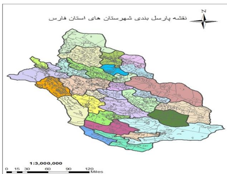
شکل ۲. نقشه موقعیت جغرافیایی و پارسل‌بندی استان فارس

استان فارس یکی از ۳۱ استان ایران است که در بخش جنوبی کشور واقع شده است. مساحت استان حدود ۱۲۲۶۰۸ کیلومتر مربع است که ۷/۵ درصد از مساحت کل کشور را شامل می‌گردد. در استان فارس طرح پهنه‌بندی عرصه‌های تولیدی با ۶۱۲ پهنه (پاسل) اجرا شد. برای هر پهنه یک کارشناس در حوزه روستا یا دهستان مشخص گردید و از سوی مرکز تحقیقات کشاورزی استان فارس برای هر شهرستان کارشناسی برای نظارت کلی بر کارشناسان پهنه‌ها در نظر گرفته شد.