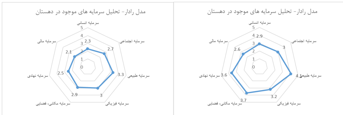
شکل ۷. نمودار راداری دهستان جون آباد