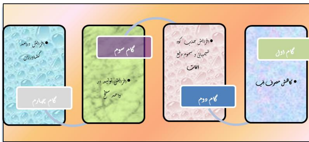
شکل ۳. اثرات کشت هیدروپونیک

الگوریتم خوشه‌ای کردن روستاها به منظور ظرفیت‌سنجی کشت هیدروپونیک با روش تحلیل خوشه-ای