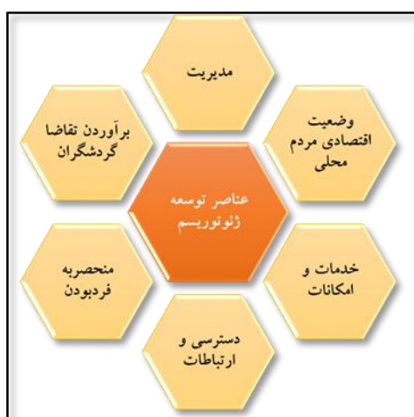
شکل ۱. عناصر اصلی اثرگذار بر توسعه ژئوتوریسم در مقاصد از دیدگاه گنتینگ و فبری.

پایدار جوامع محلی خواهد بود (Wéber et al, 2015:318). روچا و سیلوا (۲۰۱۴)، بیان می‌کنند؛ زمانی که از توسعه ژئوتوریسم، سخن گفته می‌شود؛ یکی از محورهای اصلی آن ارزش‌های طبیعی و جاذبه‌های آن بوده و محور بعدی آن، مرتبط با مطلوبیت وضعیت مدیریت، خدمات و امکانات، پشتیبانی مالی، ارائه بسته‌های متنوع به ژئوتوریست‌ها، سازماندهی و ارتباطات گروه‌ها و بازیگران درگیر، رضایت گردشگران، وضعیت حفاظت، بهره‌مندی اقتصادی جامعه محلی، ارتباط مردم محلی با ژئوتوریست‌ها و پذیرش آنها خواهد بود (Rocha and Silva, 2014:744). گنتینگ و فبری (۲۰۱۸) نیز، لازمه موفقیت و اثرگذاری ژئوتوریسم را در مطلوبیت عناصر اثرگذار آورده شده در شکل زیر می‌دانند (Ginting and Febri, 2018:2).