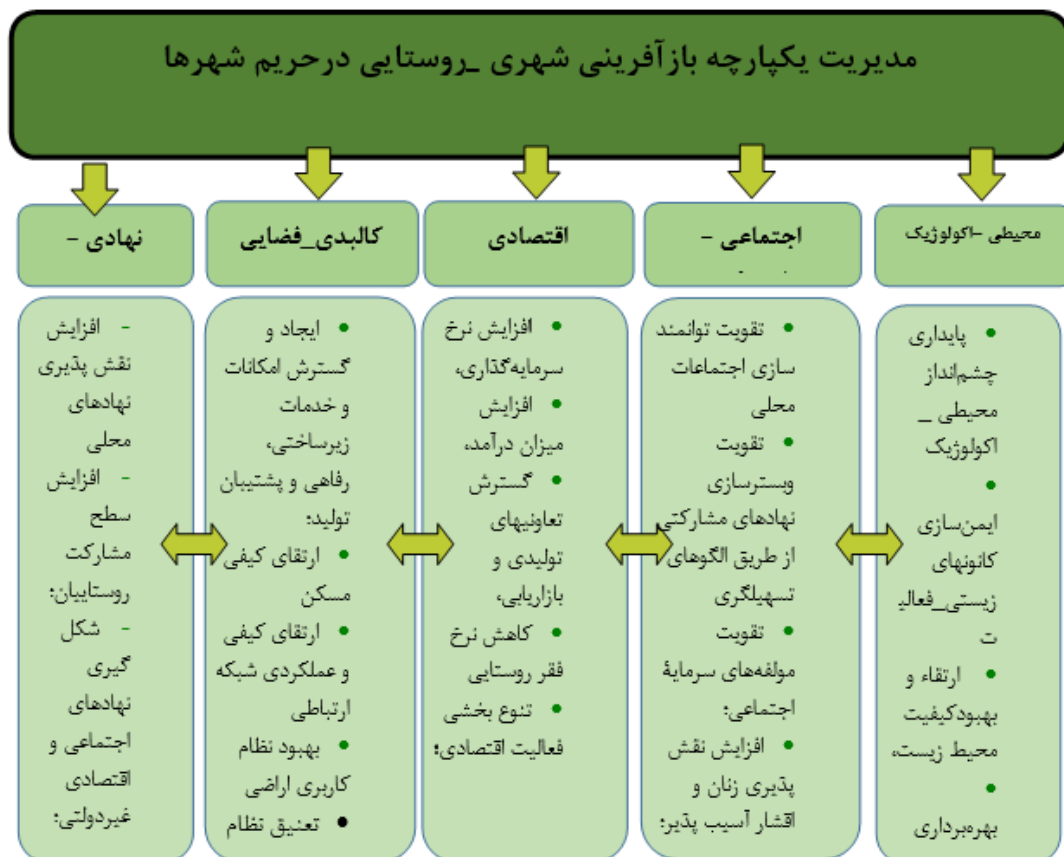
شکل ۴. سیاست کلان مدیریت روستاهای حریم شهرها مبتنی بر برنامه‌ریزی فضایی - راهبردی