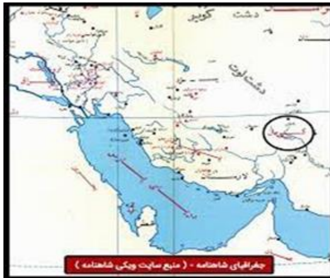
شکل ۲. نقشه موقعیت جغرافیایی محدوده مورد مطالعه

دارای رتبه اول می‌باشد. بارش سالانه در استان حدود ۱۱۰ میلی متر است. تنوع آب و هوایی بالا در استان کرمان باعث شده است که این استان دارای محصولات کشاورزی متنوع شامل محصولات گرمسیری و نیمه گرمسیری و درختان میوه مناطق سردسیری باشد.