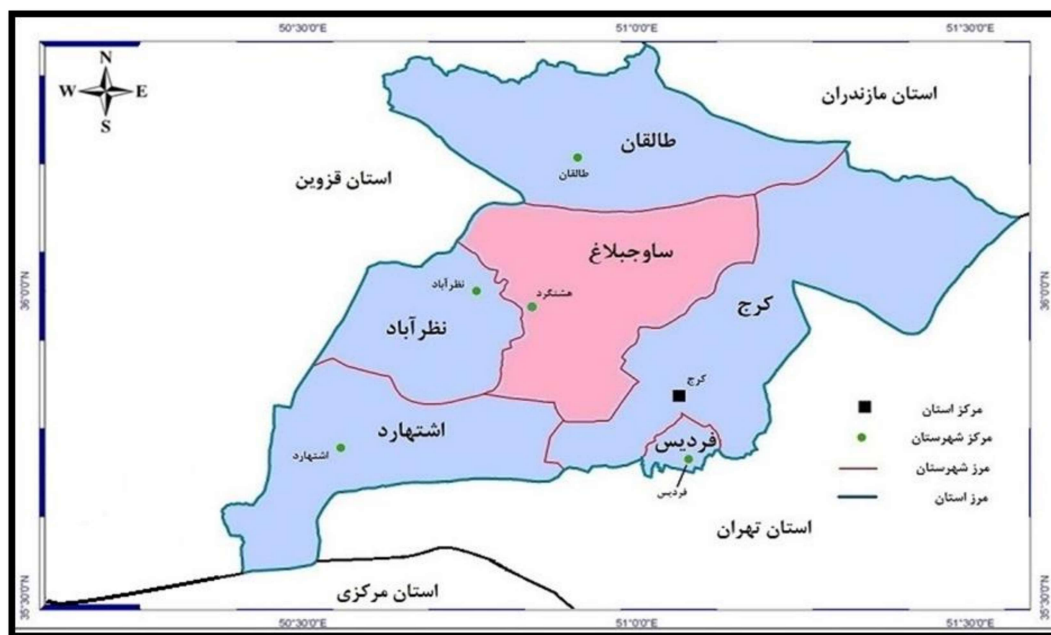
شکل ۲. نقشه شهرستان ساوجبلاغ استان البرز

داده‌های پژوهش از طریق مشاهده مشارکتی به صورت هدفمند با چند تن از اساتید دانشگاهی، کارشناسان و ذینفعان دارای تخصص اعم از مسئولین و افراد مطلع محلی و بر اساس اردوی علمی دانشگاهی با موضوع ساختار